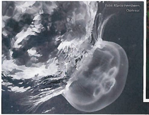
Oorkwal.