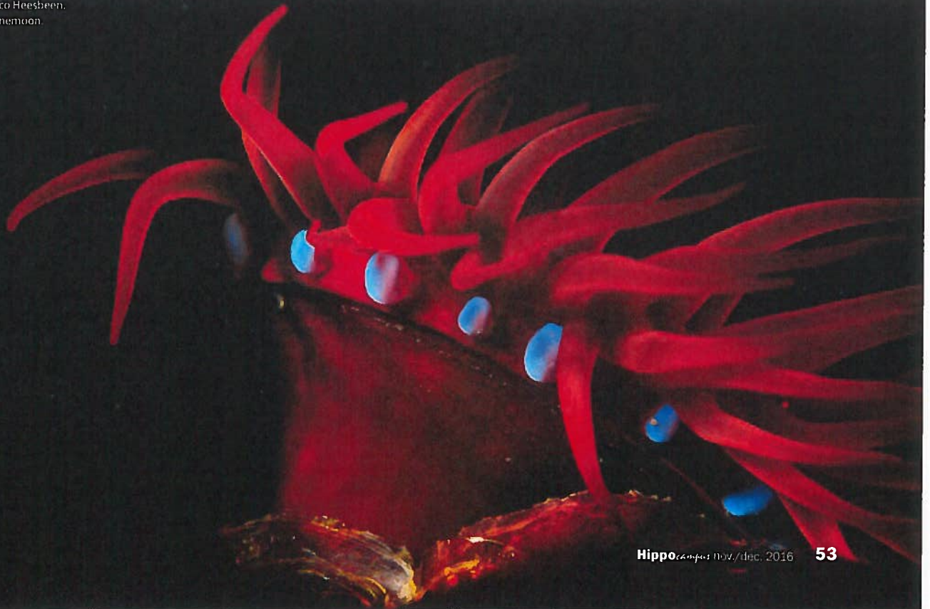
Paardenanemoon.