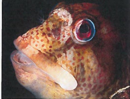
Zwarte grondel.