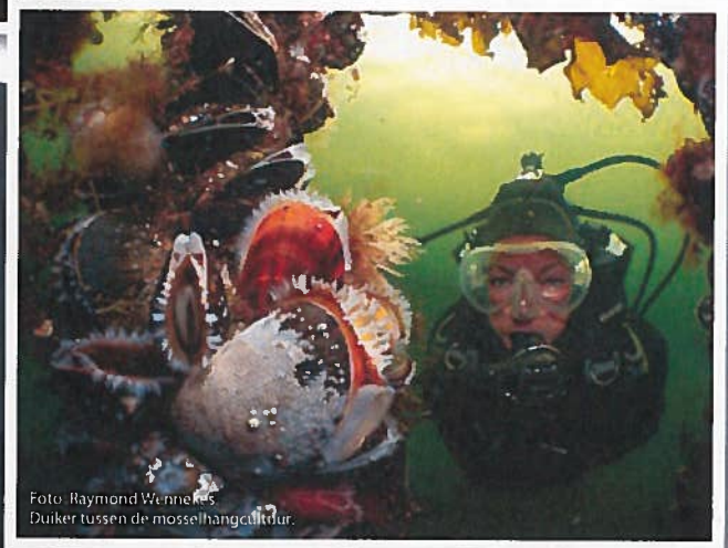
Duiker tussen de mosselhangcultuur.