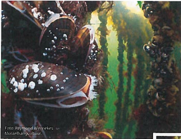
Mosselhangcultuur.