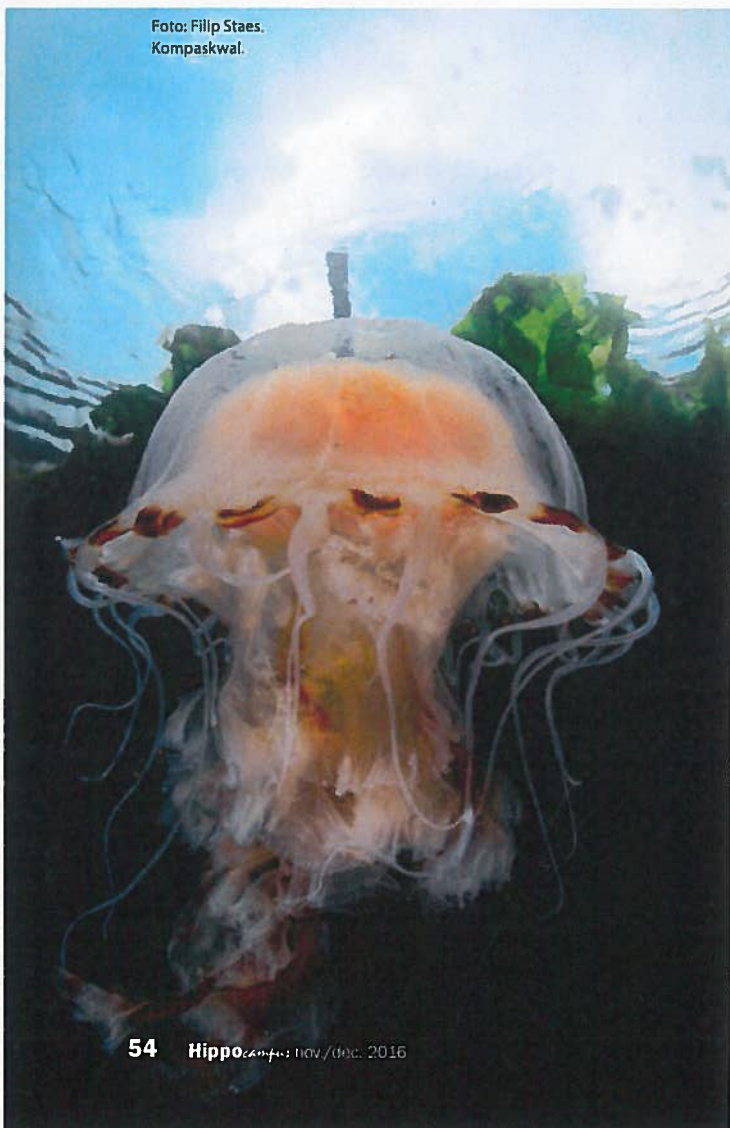
Kompaskwal.