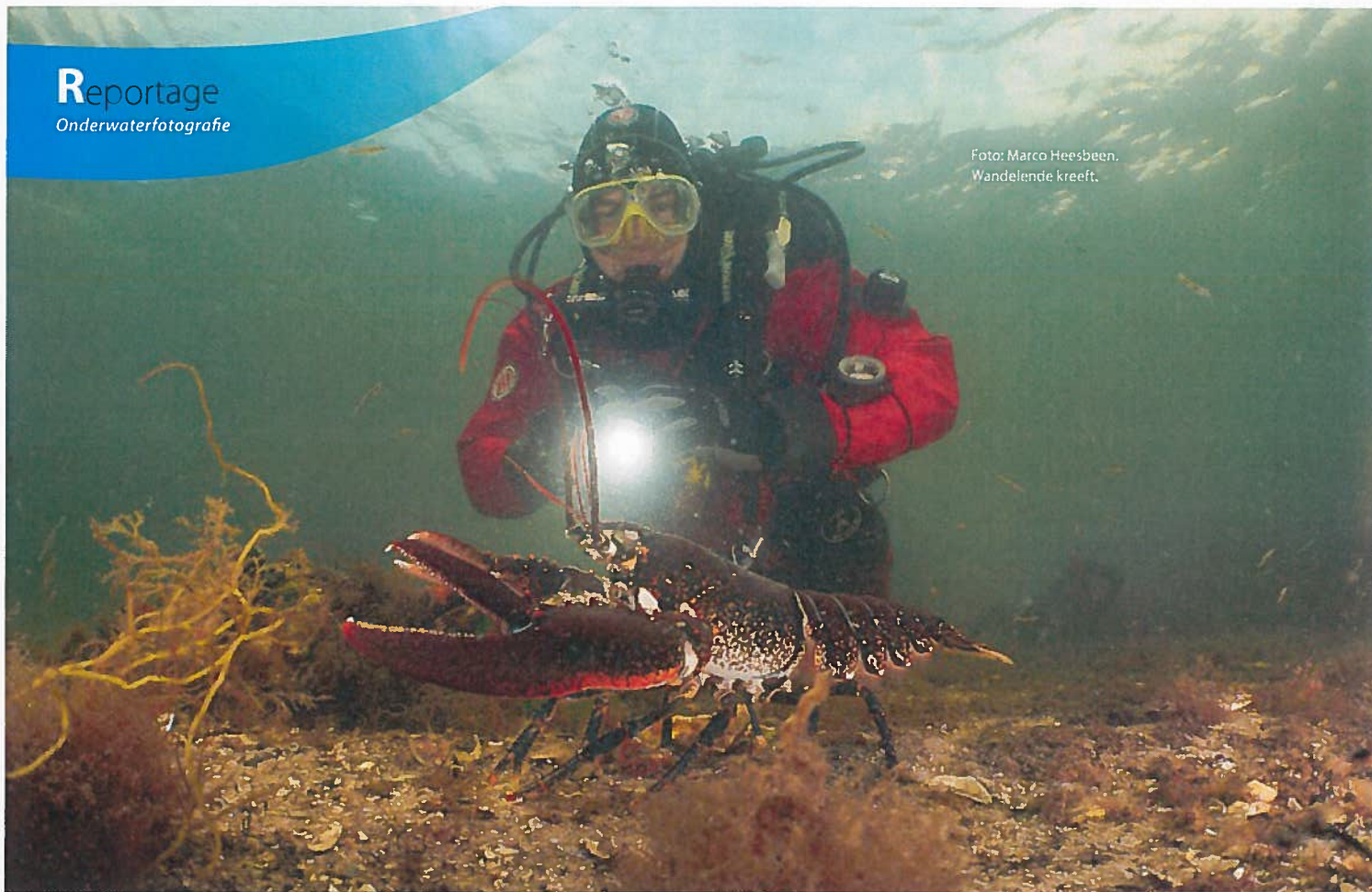
Wandelende kreeft.